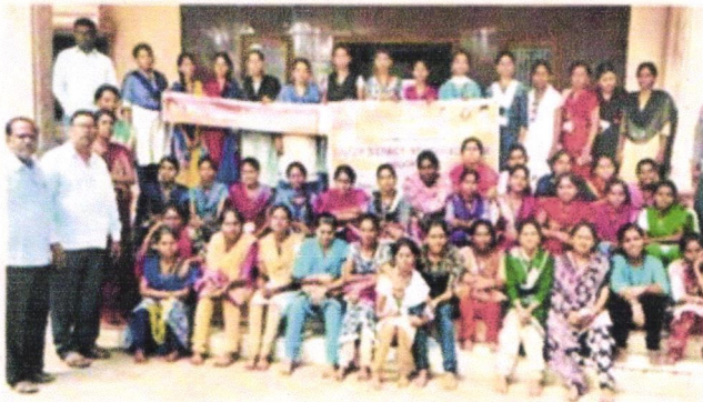
కూచిపూడి సిద్ధేంద్ర కళాపీఠంలో ఒంగోలుకు చెందిన యువత