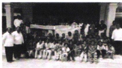
కూచిపూడి కళాపీఠంలో ఒంగోలు విద్యార్థులు