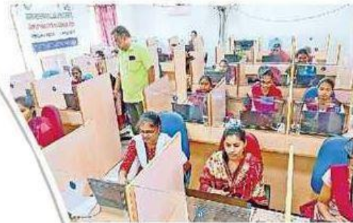
మహిళా డిగ్రీ కళాశాల షేకేసీలో శిక్షణ పొందుతున్న విద్యార్థినులు

JKC of our college enrolled the pursuing the Final year 2022 Students for 2-3 week training programme conducted by Mind-Map NAACOM Foundation for job opportunities from cognizant and GENPACT companies from 07-03-2022, in EAO/SAP BASIS, Insurance, virtualization and wintel. Most of the students availed this golden opportunity and registered their names.