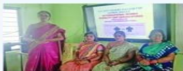
(అధ్యక్షతన ప్రభుత్వ ప్రతినిధి, ఒంగోలు, ఆగస్టు 26)