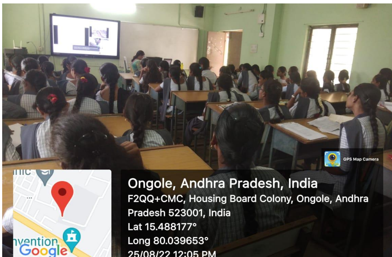
An Awareness talk on Intellectual Property Rights(IPR)

On the occasion of the 75th independence anniversary in association with the Patent Office, Chennai, The Department of Commerce and IQAC of D. S. Government College for Women has organized a National Webinar entitled "An Awareness talk on Intellectual Property Rights (IPR)" as part of National Intellectual Property Awareness Mission (NIPAM), Government of India on 25th August, 2022 @ 11.00 am