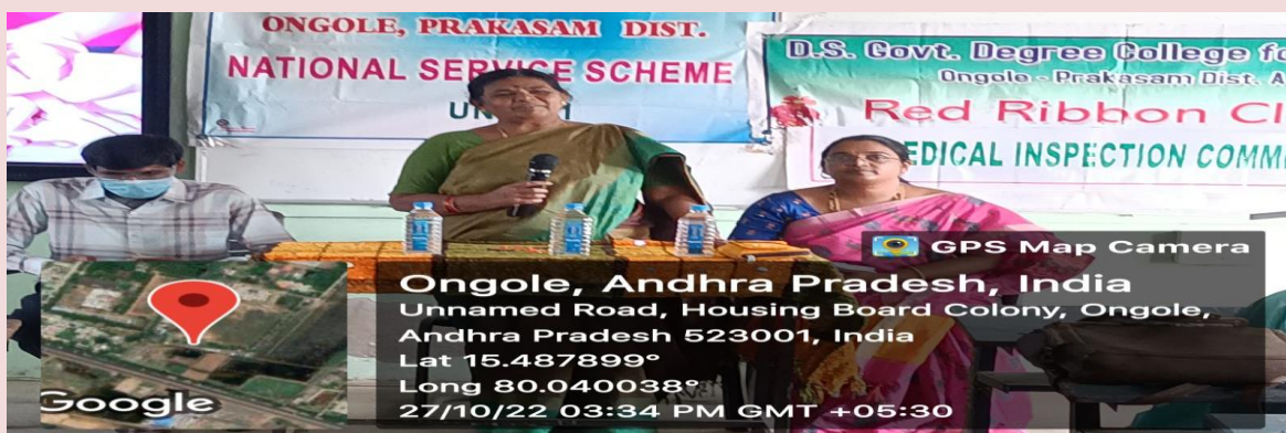
Awareness Programme on Breast Cancer by NSS units