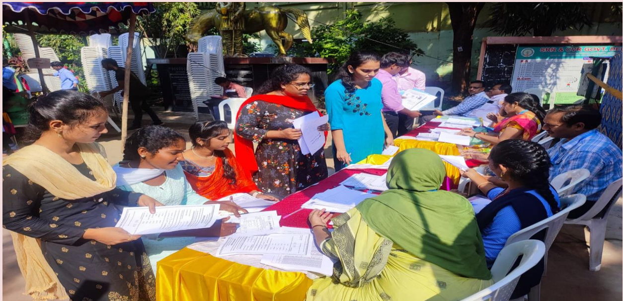
Participation of DSGDC (W),Ongole students in Mega job Drive